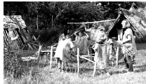
Flera hjälps åt att väva vassmattor i väveriet.