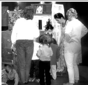
Efter föreställningen får barnen komma fram och titta närmare på den spännande byrån.