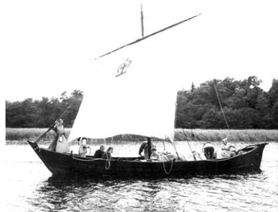
Till havs med Theo Ficks som skeppare på Blanka.